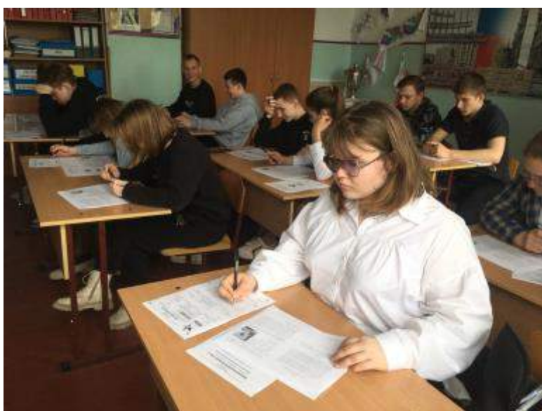
Викторина «История российской армии в датах и лицах»