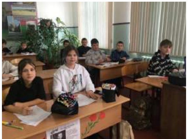
Написание писем солдатам, участвующим в военной операции