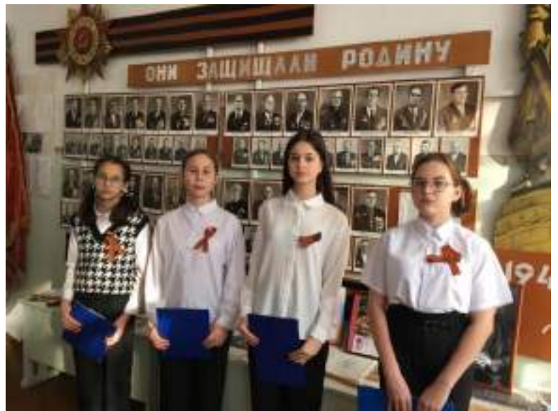
Экскурсии в школьный краеведческий музей «Родник»